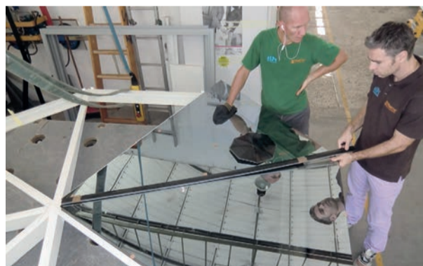
Produzione di una copertura vetrata curva - Ermetic Serramenti

Siamo a Salt di Povoletto, in provincia di Udine, una zona ricca di aziende manifatturiere, dove la passione per il lavoro e la cultura professionale certo non mancano. Come nel caso di Ermetic Serramenti, che dal 1979 è specializzata nella produzione e installazione di serramenti in Pvc, serramenti in alluminio a taglio termico e legno-alluminio termico, oltre che a portoncini di ingresso, verande, porte garage, persiane e scurettili in alluminio, parapetti in vetro e vetro-alluminio, pensiline e vetro facciate. Con due siti produttivi e relativi show room (quello di Debellis di Taipana è dedicato esclusivamente alla produzione di serramenti in Pvc di alta qualità, persiane, scurettili e parapetti in Pvc, tutti realizzati con il brand Alpi, di proprietà dell'azienda), Ermetic Serramenti può vantare di essere ancora uno dei pochi produttori del settore, capace di "diversificare la produzione e uniformarla costantemente alla nuove tecnologie, alle elevate prestazioni richieste e alle soluzioni costruttive personalizzate, anche con finiture par-