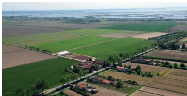
Veduta aerea del vivaio di Nordest Prati dove si coltivano prati in zolla, Sedum e piante tappezzanti da vendere 'pronti all'uso'

messo a punto un innovativo sistema per la realizzazione di aiuole con piante tappezzanti, per ombra o mezza ombra, che vengono coltivate direttamente in zolle e offerte al cliente già mature, anch'esse pronte per essere appoggiate al terreno. Non da ultimo, Nordest Prati produce tappeti di Sedum, un genere di pianta grassa con colorazioni che spaziano dal rosso al bianco al giallo che resiste al pieno sole e che ben si presta alla realizzazione di tetti verdi. "I tetti verdi, apprezzati per la loro gradevole estetica e per le caratteristiche di coibentazione, cominciano a diffondersi significativamente soprattutto in Alto Adige, in alternativa alle vasche di prima pioggia che sono obbligatorie nelle nuove costruzioni" afferma Bombardella. L'intera produzione di Nordest Prati si rivolge a vivaisti, giardinieri e ai privati. L'azienda spedisce in tutt'Italia e anche all'estero e, da qualche tempo, ha attivato una sezione di e-commerce all'interno del sito che permette di acquistare online in modo sicuro, semplice e veloce, ampliando quindi le potenzialità di vendita.