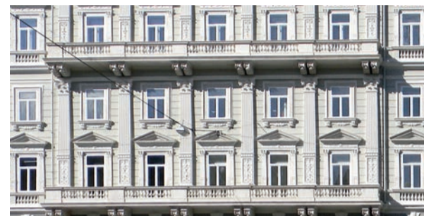
Palazzo Talenti-Tramontini a Trieste, restaurato nel 2014 da Tecnocolor

parere positivo dei clienti anche rateizzando i pagamenti fino ad un anno." Ciò che contraddistingue Tecnocolor, è l'elevata qualità del servizio fornito. "Visionando alcuni nostri restauri eseguiti oltre 20 anni fa, possiamo rilevare